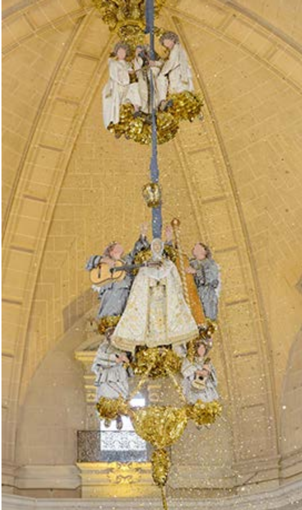
Fig. 12. La trinitat del Misteri d'Elx, en escena. Fig. 12. La Santísima Trinidad del Misteri d'Elx, en escena.