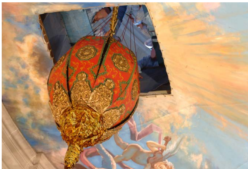
Fig. 1 i 2. La magrana, vista exterior i interior / Figs. 1 y 2. La magrana, vista exterior e interior

Eliminada la ornamentación perteneciente al prisma de la base, se puede observar que el elipsoide también queda truncado por el polo inferior, lo que hace que los husos queden también truncados por ambos extremos, como se puede apreciar en sus alas.