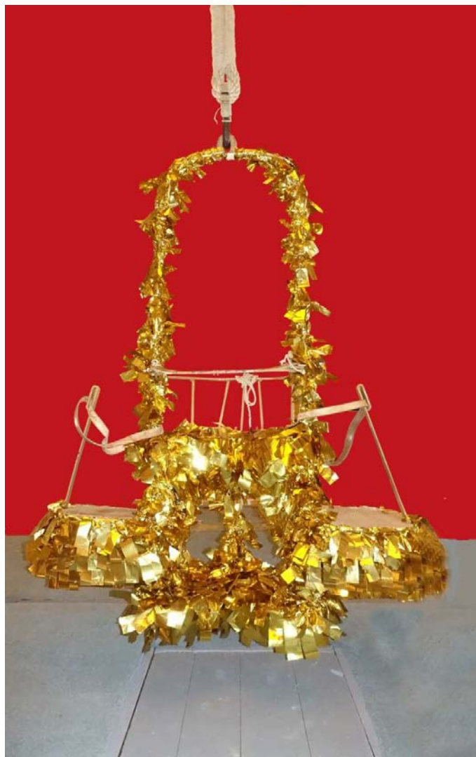
Fig. 10. La trinitat del Misteri d'Elx, adornada. / Fig. 10. La Santísima Trinidad del Misteri d'Elx, adornada.

El conjunto tiene una altura total de 1.756 mm por una anchura de 1.136 mm, teniendo como profundidad máxima los 670 mm correspondientes al anillo octagonal. Este conjunto queda protegido contra la corrosión mediante una capa de pintura al aceite de color marrón señales o RAL 8002, al igual que los otros dos aparatos.