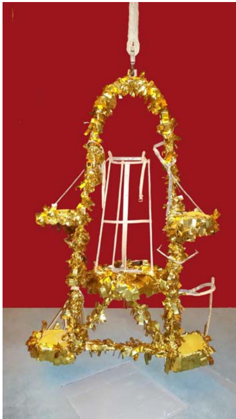
Fig. 6. L'araceli, adornat sense cantors. / Fig. 6. El araceli, adobado sin cantores.

El conjunto tiene unas dimensiones máximas de 2.475 mm de alto, por 1.510 de largo, por 600 mm de ancho. La repisa central tiene una altura libre de 1.697 mm y las laterales de 1.170 para las inferiores, quedando sin limitación de altura para las dos superiores. En cuanto a su peso, en vacío, es de 131 daN, y el asignado, cuando va con los ocupantes, con sus instrumentos y se encuentra completamente decorado, es de 600 daN.